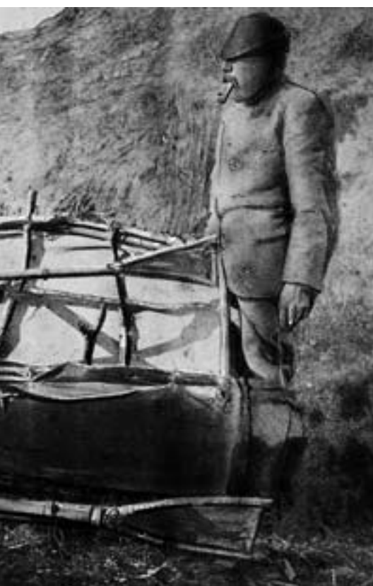
FARKOST: Av teltduken konstruerte Otto Sverdrup (bildet) og Samuel Balto et misfoster av en båt slik at ekspedisjonen kunne nå Godthaab på vestkysten.