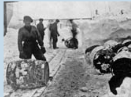
FAT: Hvalolje gjøres klar for skipping fra Grytviken i 1920-årene.

Under andre verdenskrig stanset hvalfangsten. 30 fly-