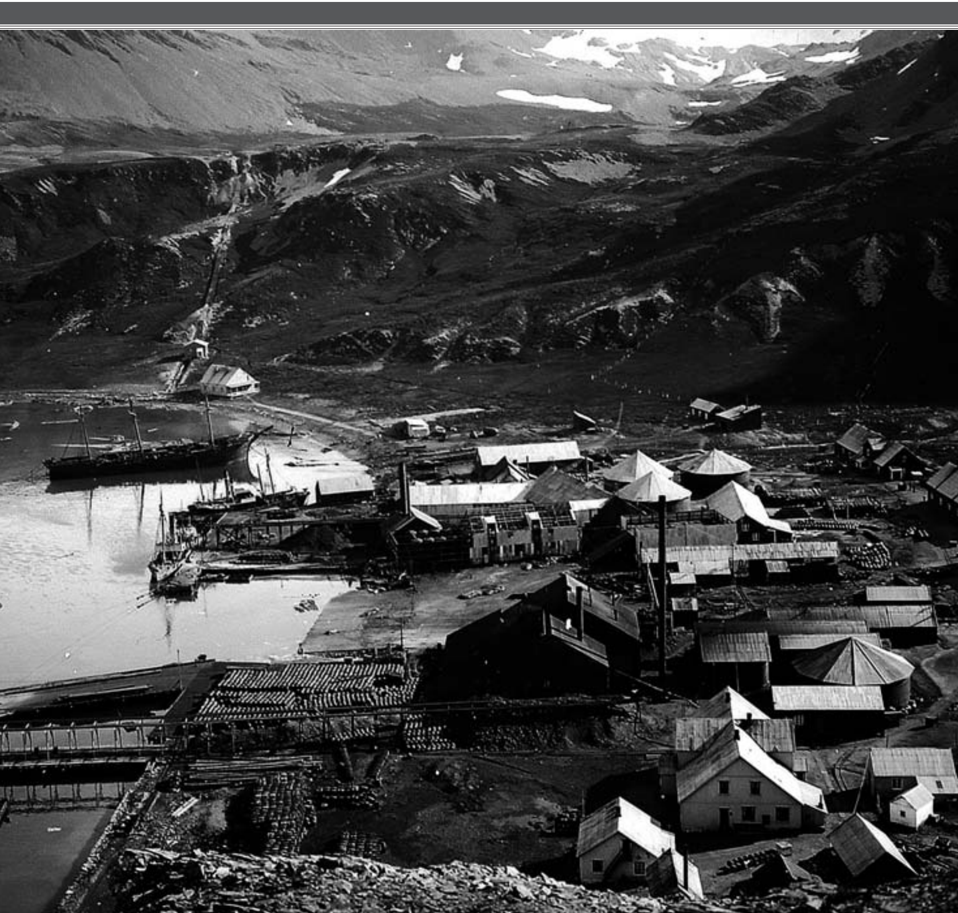
hvalfangststasjon. En skjermet havn og plenty av ferskvann fra de høye fjellene omkring. Området ble tidligere brukt til selfangst. Spekket ble kokt i gryter, derav navnet.