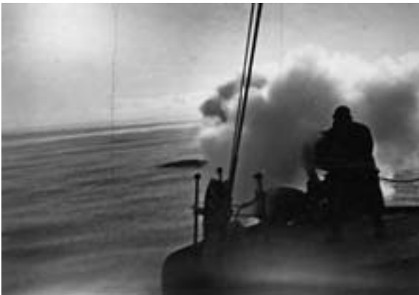
SKUDD: Granatharpun gjorde det mulig å jakte de store og raske hvalene.

I november 1904 blir de reddet ut av det argentinske orlogsfartøyet «Uruguay» som var sendt for å lete. Larsen når skipet i Snow Hill like før det vender hjemover.