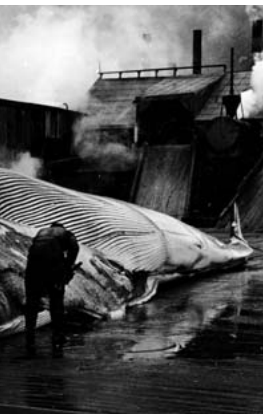
VERDIER: Hvalene ble tatt på land og oppdelt etter et spesielt mønster. Her er arbeidere i gang med flensing ved hjelp av spesielle kniver på lange skaft.