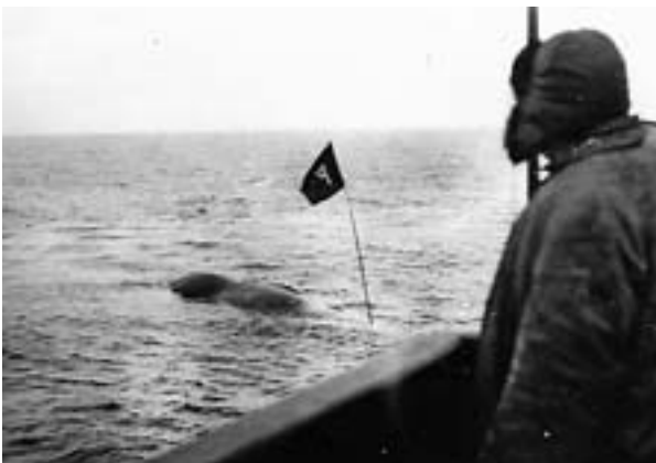
SYNLIG: Hvalene ble markert med flagg slik at de lett kunne finnes igjen.

LARSENS OPPHOLD i den argentinske hovedstaden Buenos Aires blir et vendepunkt. Han kommer i kontakt med lokale forretningsfolk som tenner på hans hvalfangstideer.