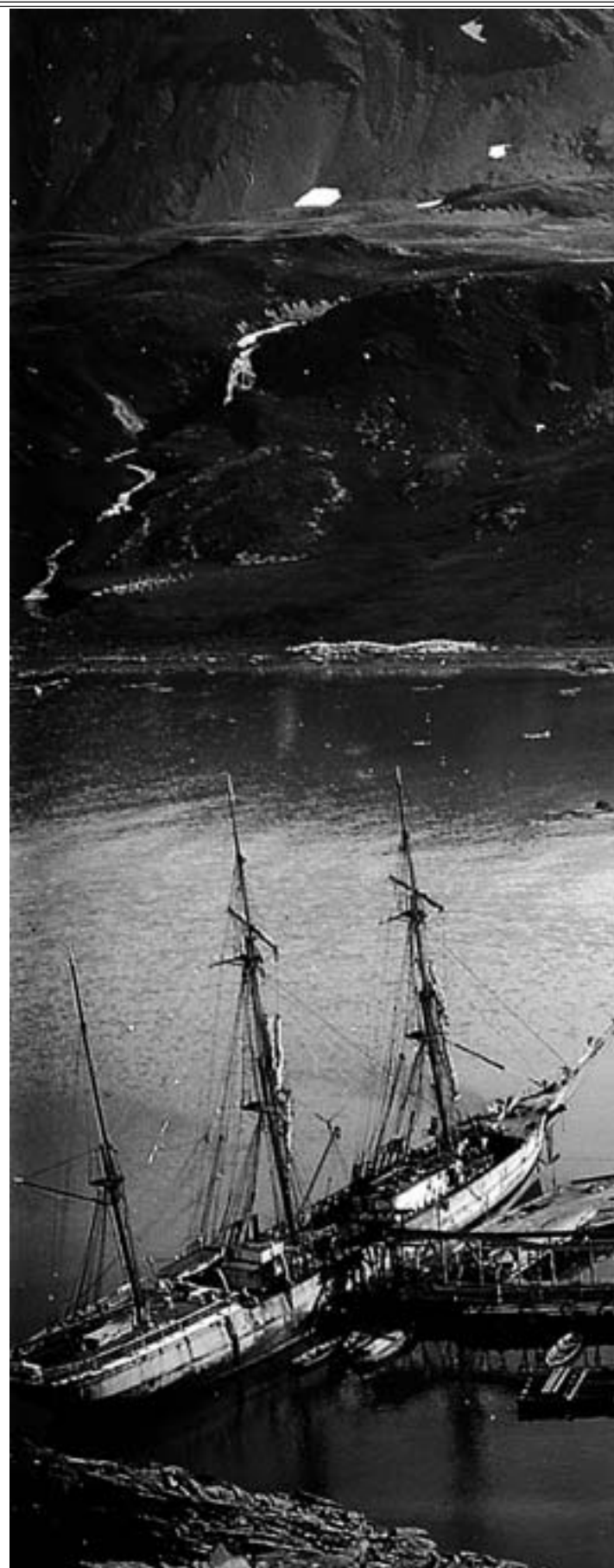
PERFEKT: Grytviken på Syd-Georgia viste seg å være ypperlig for en

Artikler i Østlandsposten, Aftenposten, Biografisk leksikon og fra NTB.